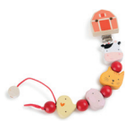
Catenella ciuccio Fattoria