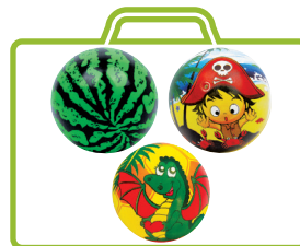
Palla, set da 3