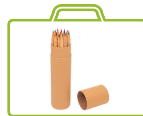
Matite colorate „naturali”