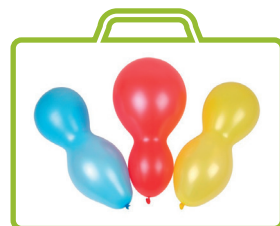
Palloncini doppi, 96 pezzi