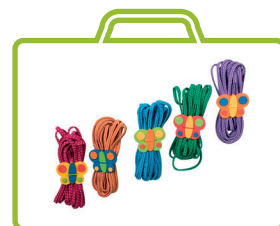
Corde per saltare „Farfalle”